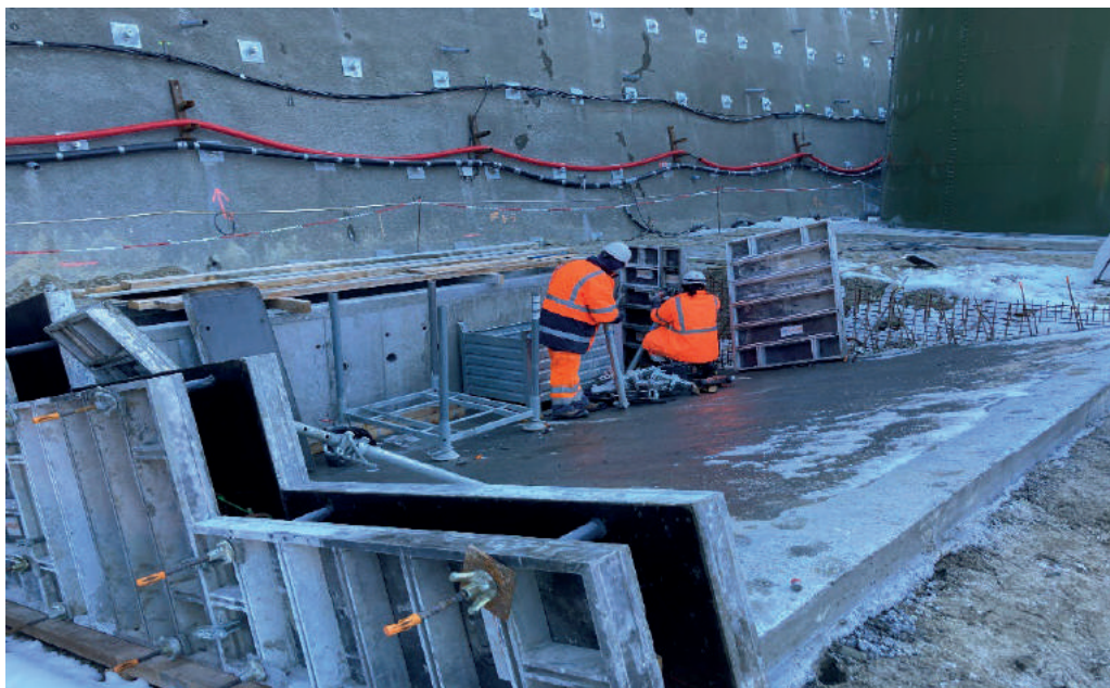
Bassin de décantation Villarodin-Bourget / Modane