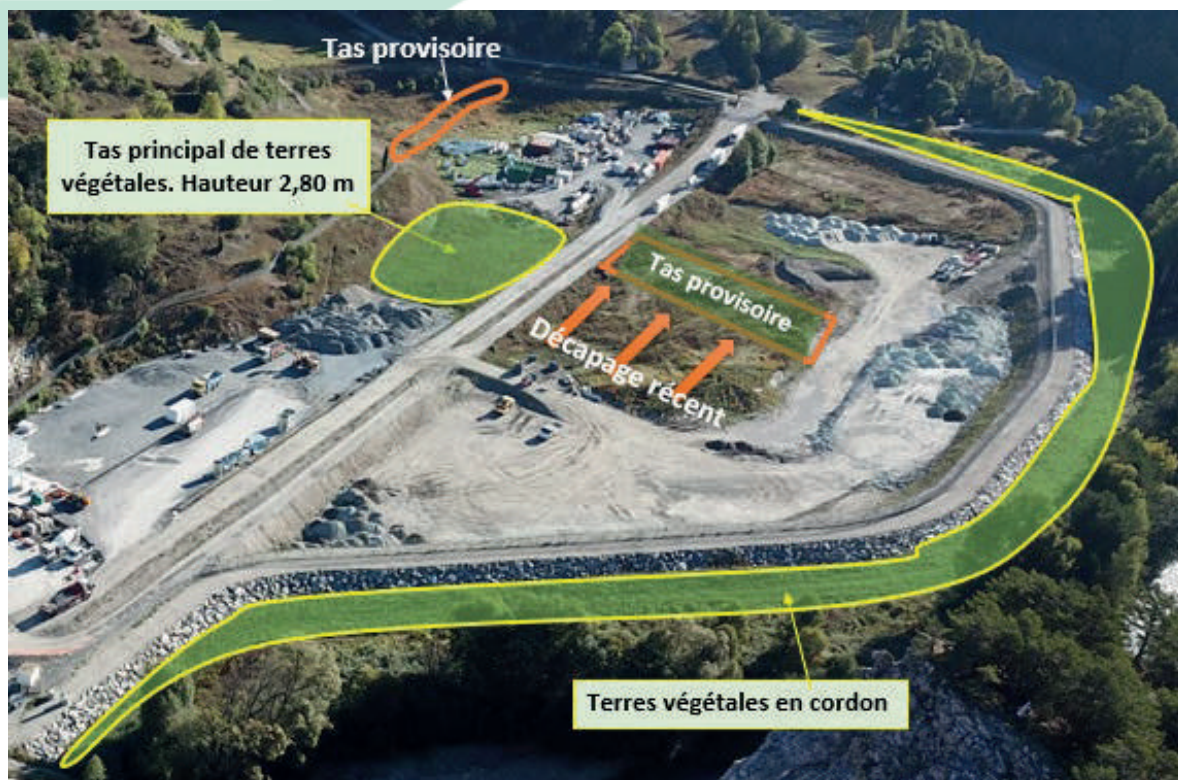
Stockage des terres végétales - Zone du Moulin

Les derniers déplacements de terres s'expliquent par des décapages récents pour la construction de plateformes sur Moulin sud et Moulin nord (représentés par des tas provisoires sur le plan). D'autres décapages de terres végétales auront lieu courant 2022 (Moulin sud et zone des jardins). Les tas provisoires viendront compléter le tas principal de terres végétales en respectant une hauteur maximum de 5 mètres.