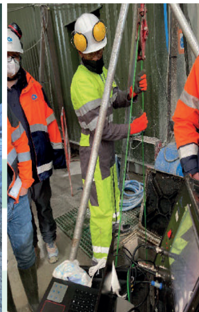
Passage préventif de caméra