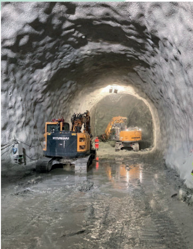
Fin de la galerie de connexion