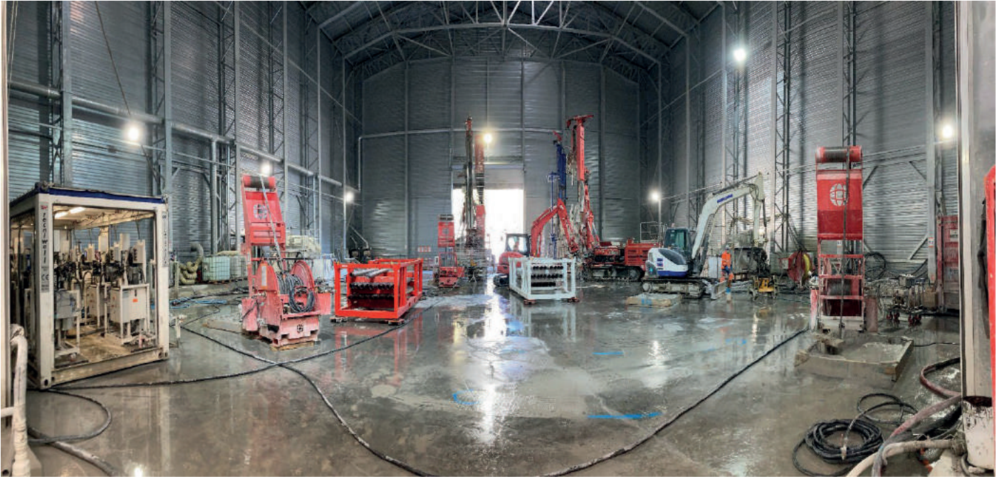
Exécution d'injections profondes sur plusieurs ateliers (vue intérieure du hangar acoustique)